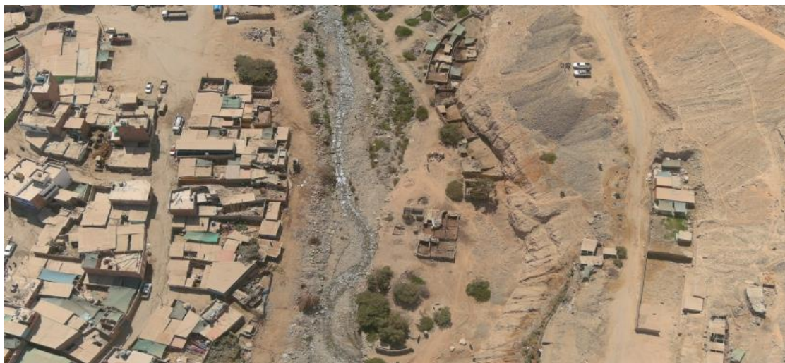
FIGURA N°01: TRAMO CRÍTICO EN EL CHARPA EL CUAL DURANTE TIEMPO DE AVENIDA EXPONE LA POBLACION A INUNDACIONES POR CRECIDA DEL RIO O POR HUAICO.