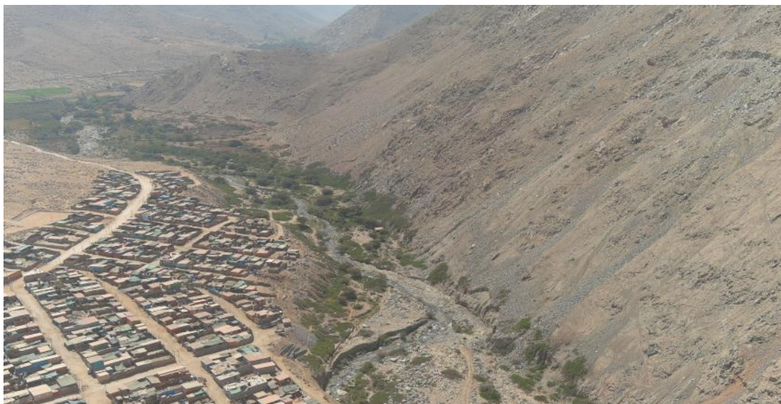
FIGURA N°02: TRAMO CRITICO RIO CHARPA Y EL CENTRO POBLADO RELAVE CON EXPOSICION DE INUNDACION