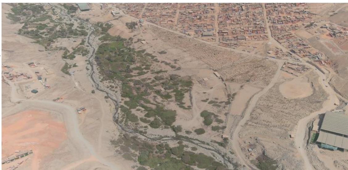
FIGURA N°03: VISTA PANORAMICA DEL RIO CHARPA EXPONIENTE EL CENTRO POBLADO RELAVE